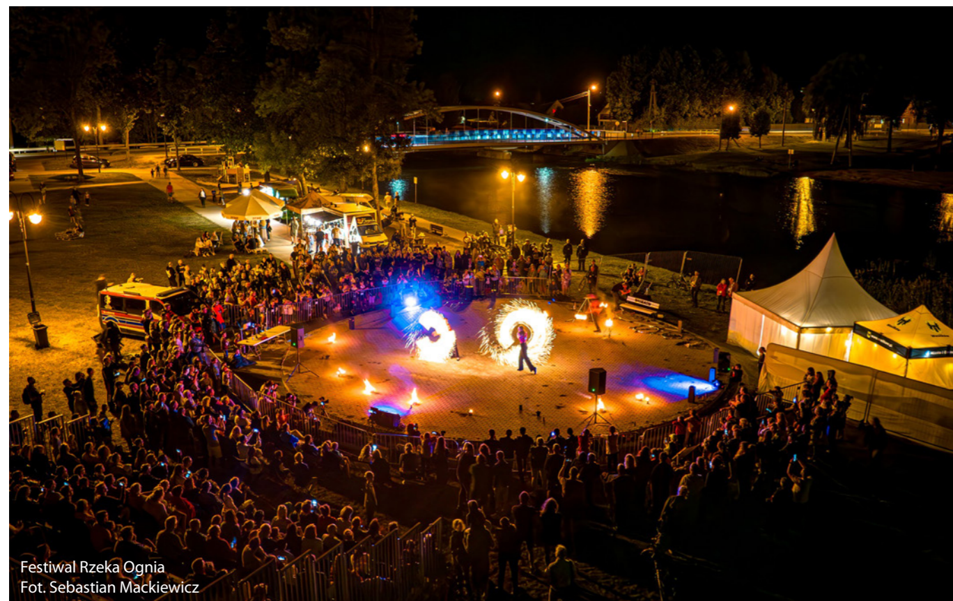
Festiwal Rzeka Ognia