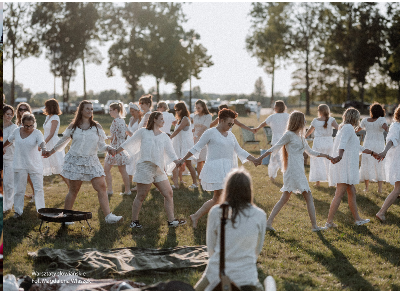
Warsztaty słowiańskie