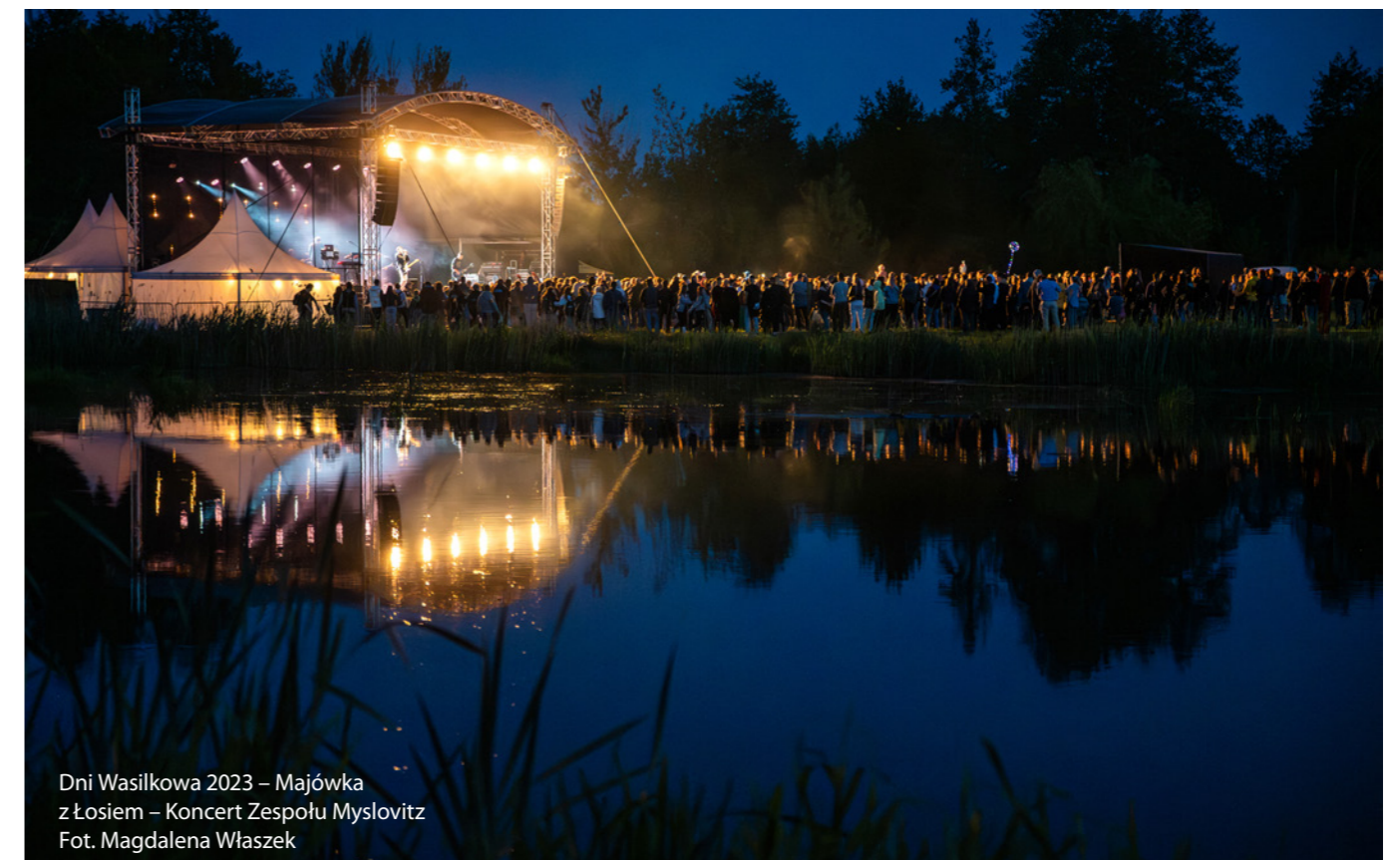
Dni Wasilkowa 2023 – Majówka z Łosiem – Koncert Zespołu Myslovitz