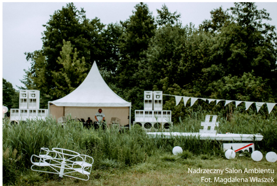
Nadrzeczny Salon Ambientu

Nie jest to jednak wszystko co udało nam się wspólnie z Wami, naszymi odbiorcami, w tym 2023 roku zrobić. Poza stałą działalnością animacyjną i edukacyjną nasz Ośrodek angażował się również w organizację i współorganizację wielu wydarzeń plenerowych oraz koncertów i festiwali, które już na stałe wpisują się w kalendarz