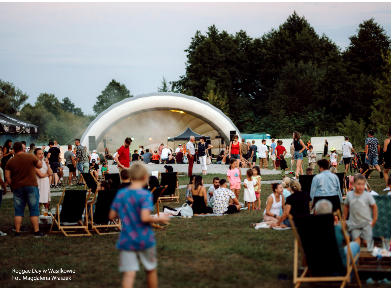
Reggae Day w Wasilkowie